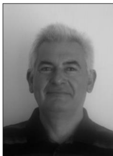
Tisztelt Szentpéterszegi Választópolgárok!

Az Önök megtisztelő bizalmából 1978 óta szolgálom és segítem Szentpéterszeg település fejlődését, boldogulását. Több mint 24 éve autószerelő vállalkozóként végzem munkámat, van két lány gyermekem és két gyönyörű unokám.